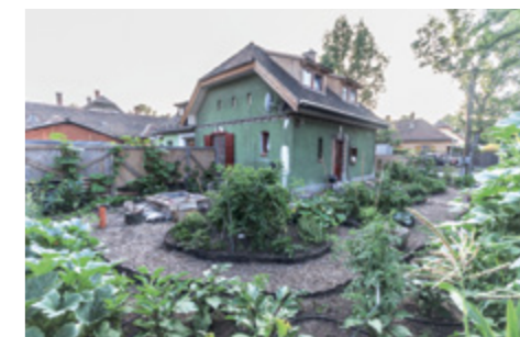
© Blood Mountain / Káré András, 2012