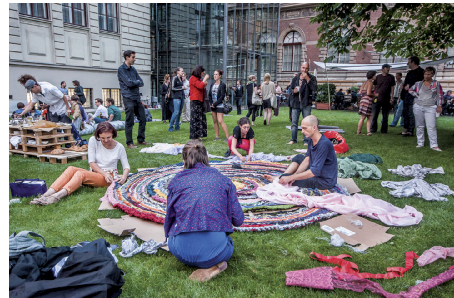
© Blood Mountain / Kárá András, 2012

Az Ehető kertek 12: Budapest a Wekerlei Kertbarát Kör és az Átalakuló Wekerle közreműködésével, valamint a Green Fortune Magyarország, 56Films, MAK és az Artemisia Tájépítészeti segítségével jött létre. A projekt támogatója a Graham Foundation for Advanced Studies in Fine Arts.