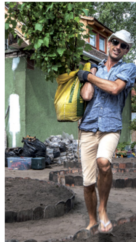
© Blood Mountain / Káré András, 2012

kevésbé sem természetes. Organikusnak álcázott ipari táj, ahol a fű monokultúráját gyomirtóval átitatott talaj biztosítja. Egy tenyérnyi árkádiái táj (az angol tájképi kertek kerti törpe változata) a kispolgári álom megtestesüléseként rendíthetetlenül tartja magát, ügyet sem vetve arra, hogy a fenntartható fejlődést zászlajára tűző korunkban ez már rég nem „piszi”. Abban a korban, amelyben az egyik legjellemzőbb folyamat a teljes elidegenedés saját élelmünkötől, ami már a lefóliázott ételek világa, ahol a gyerekeknek fogalmuk sincs, hogy a ragyogóra sikkalt sárgarépa a „piszkos” földben terem. A Los Angeles-i művész díszkert helyett vetemény projektjének komoly történelmi előzményei voltak, melyekre ő maga is hivatkozik. A világháborús propagandakert (victory garden) az emberek létfenntartó ösztönére alapozott: minden parlagon heverő területet, kibombázott foghíjtelket, városi parkot, magánkertet igyekeztek bevonnani az élelmiszertermelésbe. Haeg szerint a mostani helyzet is katasztrofális, de az emberek gondolkodásmódjának átala-