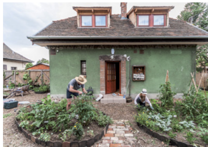
© Blood Mountain / Kárá András, 2012

design akciók a közjó érdekében tematika köré csoportosított művek között is szerepel Fritz Haeg Ehető kertek akciósorozata, köztük kiemelt helyen a legújabb, magyar vetemény fotódokumentációja. Júniusban minikertet telepített a MoMA szoborkertjébe a Century of the Child: Growing by Design, 1900–2000 nagyszabású kiállítás kísérő programjához csatlakozva (ajánlónkat lásd az 52. oldalon), melyet önkéntesek gondoznak és szüretelnek le együtt majd ősz folyamán. Mielőtt jö-